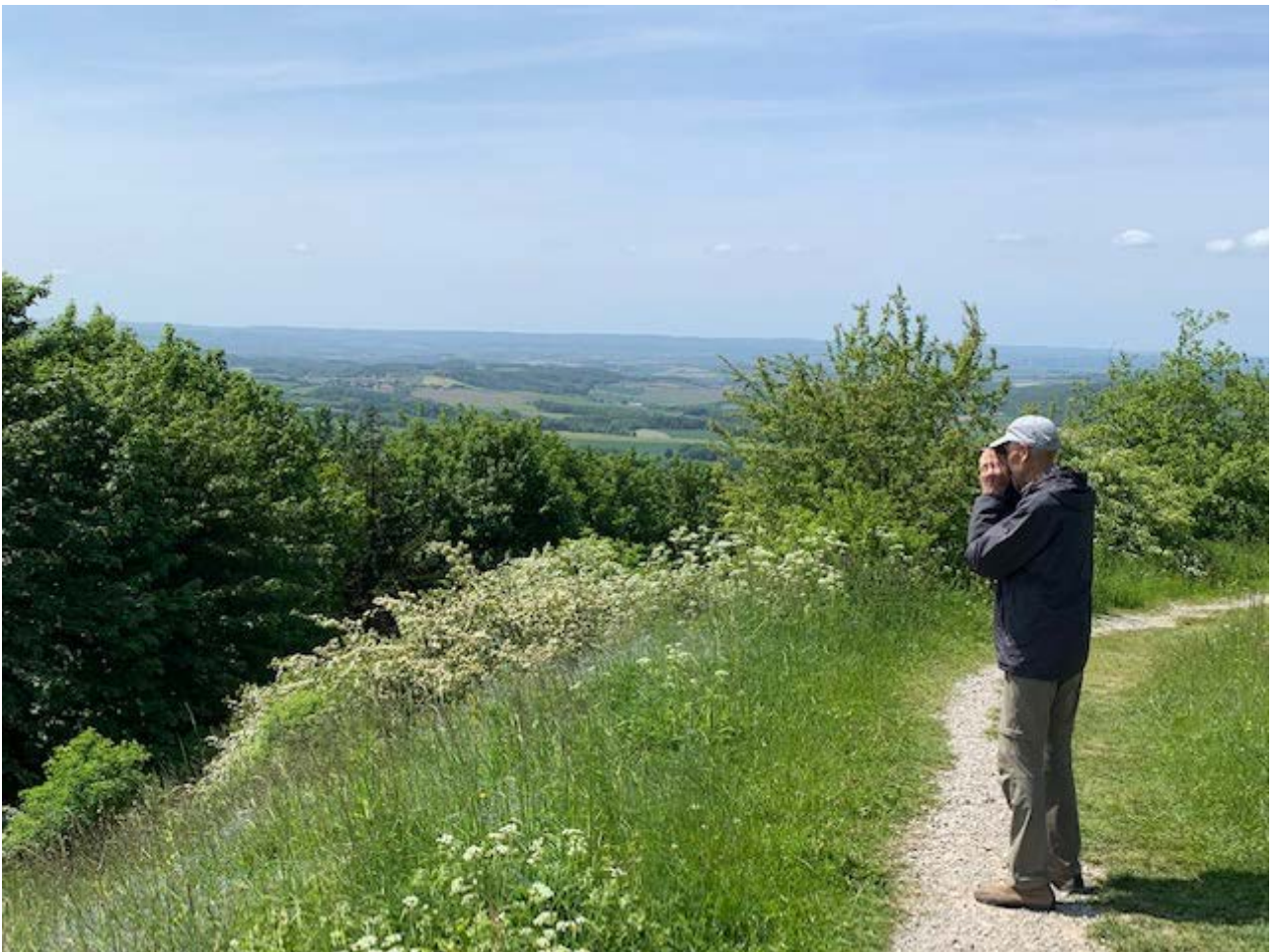
Eine lohnenswerte Aussicht in alle Richtungen des Lipperlandes von der 496 m hohen Kuppe des Köterberges!