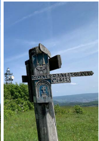
Infohütte und Wegweiser unterhalb des Fernmeldeturmes.